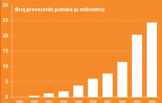
Broj prevezenih putnika (u milionima)